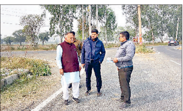
सोनीपत। ऑडिटोरियम की जमीन का निरीक्षण करने पहुंचे मेयर एवं निगम आयुक्त।

ऑडिटोरियम के निर्माण स्थल को लेकर काफी समय से असमंजस की स्थिति थी। पहले इसे मिनी सचिवालय के पास स्थित हैबिटेड क्लब की जमीन पर बनाया जाना प्रस्तावित था। हालांकि, राजस्व विभाग से इस जमीन की मंजूरी नहीं मिल पाने के कारण परियोजना शुरु नहीं हो पाई थी। इस गतिरोध को समाप्त करने के लिए, नगर निगम