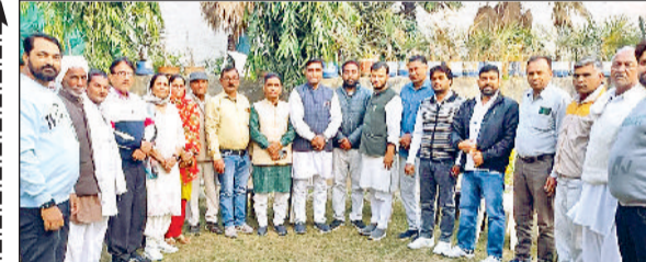
गोहाना। रैली की तैयारियों को विचारविमर्श करते हुए भाजपा कार्यकर्ता।