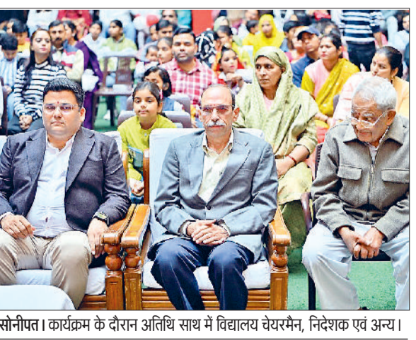
सोनीपत। कार्यक्रम के दौरान अतिथि साथ में विद्यालय चेरमेन, निदेशक एवं अन्य।

हरिभूमि न्यूज>>>सोनीपत ऋषिकुल विद्यापीठ में भव्य बेबी शो का आयोजन किया गया, जिसमें इस वर्ष 500 से अधिक नन्हें प्रतिभागियों ने उत्साहपूर्वक भाग लिया। कार्यक्रम में बच्चों को दो आयु वर्गों में विभाजित किया गया। पहला वर्ग छह महीने से दो वर्ष तक और दूसरा वर्ग दो वर्ष से छह वर्ष तक रखा गया। कार्यक्रम का शुभारंभ गणेश वंदना और दीप प्रज्वलन से हुआ, जिसके बाद मंच बच्चों की मासूम मुस्कान और रचनात्मकता से गुलजार हो गया।