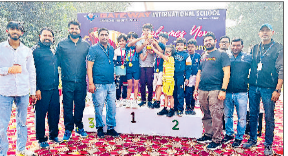
सोनीपत। विजेताओं को सम्मानित करते हुए अतिथिगण।