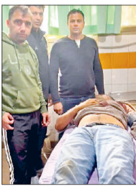
मुठभेड़ में मारा गया बदमाश