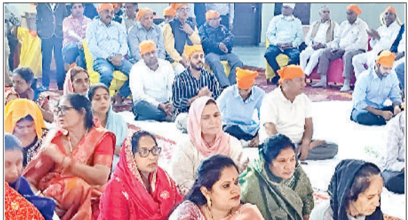
सोनीपत। कार्यक्रम के दौरान उपस्थित श्रद्धालुगण।