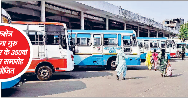
सोनीपत। सोनीपत बस अड्डे का फाइनल फोटो।

कुरुक्षेत्र की पवित्र धरा पर 25 नवंबर को आयोजित होने वाले प्रधानमंत्री नरेंद्र मोदी के विशाल कार्यक्रम के लिए हरियाणा सरकार ने जिला प्रशासन सोनीपत से 204 बसों की मांग की है। इस बड़ी मांग के कारण सोनीपत के स्थानीय और अंतरराज्यीय बस रूटों पर यात्रियों को गंभीर परिवहन संकट का सामना करना पड़ सकता है। जानकारी के अनुसार, जिला प्रशासन द्वारा की गई कुल 204 बसों की मांग में से रोडवेज विभाग ने सोनीपत और गोहाना सब डिपो की 110 बसों का प्रबंध किया है, जबकि दिल्ली डिपो की 40 बसों भी इस व्यवस्था में शामिल होंगी। सोनीपत डिपो में कुल 211 बसें हैं, जिसका अर्थ है कि डिपो की लगभग आधी बसें प्रशासनिक ड्यूटी के लिए कुरुक्षेत्र रवाना होंगी। क्षेत्रीय परिवहन प्राधिकरण (आरटीए) को शेष निजी बसों का प्रबंध करने की जिम्मेदारी सौंपी गई है। भाजपा द्वारा प्रधानमंत्री नरेंद्र मोदी के कुरुक्षेत्र आगमन पर आयोजित गुरु तेगबहादुर के 350वें बलिदान समारोह में लोगों को लाने और ले जाने के लिए इन बसों का उपयोग किया जाएगा। इन सभी बसों को उनके सामान्य रूटों के बजाय सीधे कुरुक्षेत्र के लिए भेजा जाएगा।