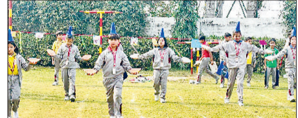
गोहाना। एथलीट मीट में अपनी खेल प्रतिभा दिखाते हुए दून स्कूल के विद्यार्थी।