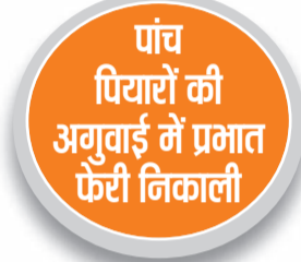
पांच पियारों की अगुवाई में प्रभात फेरी निकाली