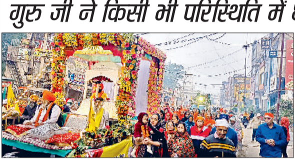
सोनीपत। प्रभात फेरी के दौरान शामिल श्रद्धालुगण।

गुरु तेग बहादुर के 350 साला शहीदी समागम के उपलक्ष्य में रविवार को गुरुद्वारा श्री गुरु तेग बहादुर साहिब सेक्टर 15 से गुरु ग्रंथ साहिब की छत्रछाया में और पांच पियारों की अगुवाई में प्रभात फेरी निकाली गई। प्रभात फेरी में बड़ी संख्या में संगत शामिल हुई और गुरु तेग बहादुर साहब जी की वाणी का सामूहिक गायन कर वातावरण को श्रद्धामय बना दिया। यह प्रभात फेरी शहर के सभी प्रमुख गुरुद्वारों से गुजरती हुई पुनः गुरुद्वारा श्री गुरु तेग बहादुर साहिब